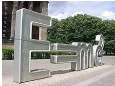
Ecuación de equivalencia entre masa y energía de Einstein.

Algo muy similar sucedió cuando Einstein descubrió y expresó en una simple fórmula, que la materia y la energía son la misma cosa, son dos caras de la misma moneda 8 , el mundo científico y también el profano, se maravillaron de que una simple expresión matemática pudiera explicar algo tan complejo. Y otra vez, Einstein solo descubrió la forma de enunciar un fenómeno natural y sus leyes, en una expresión matemática simple, pero esas leyes eternas...ya estaban allí .