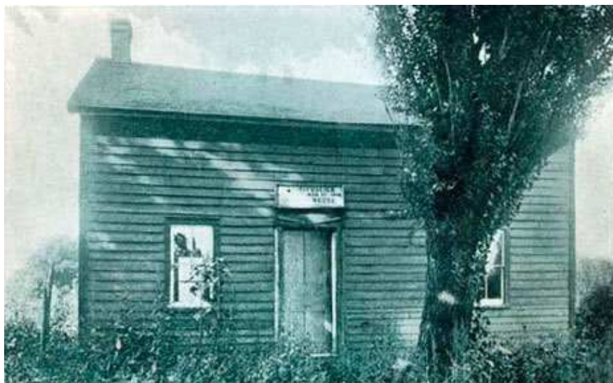
Casa de las hermanas Fox

Según la opinión de Sir Arthur Conan Doyle (autor de Sherlock Holmes) en su Historia del Espiritismo; el asesino habría enterrado el cuerpo en una cueva en el sótano y lo habría cubierto con cal, tal como había declarado el espíritu y luego por temor a ser descubierto lo enterró bajo el muro principal, donde sería más difícil de hallar. El procedimiento fue realizado con cierto descuido, apuro o tal vez falta de luz suficiente; por lo que quedaron algunos huesos y cal en el lugar original del entierro. Pero Conan Doyle recogió muchos más datos de los diarios y de los participantes del episodio, dejemos pues que él mismo cuente la historia.