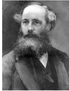
James Clerk Maxwell (Escocia; 1831– Inglaterra; 1879).

Físico británico conocido principalmente por haber desarrollado la teoría Electromagnética clásica.