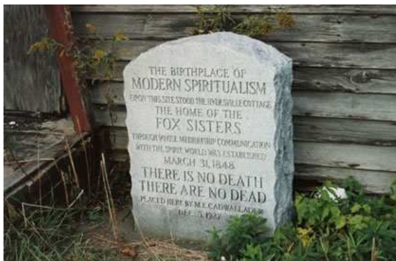
Recordatorio en el lugar donde estuvo la casa, después de que fuera demolida.

Sin duda una persona completamente reluctante al espiritismo encontrará otras explicaciones a los hechos, porque como dice el dicho “...para el que cree cualquier prueba es suficiente y para el que no cree, ninguna prueba será suficiente...”. Por ello aquella persona que tiene su mente abierta, sin ser necesariamente “creyente” encontrará que los hechos referidos son más que apropiados como prueba de que la comunicación con el mundo espiritual realmente se produjo en el presente caso.